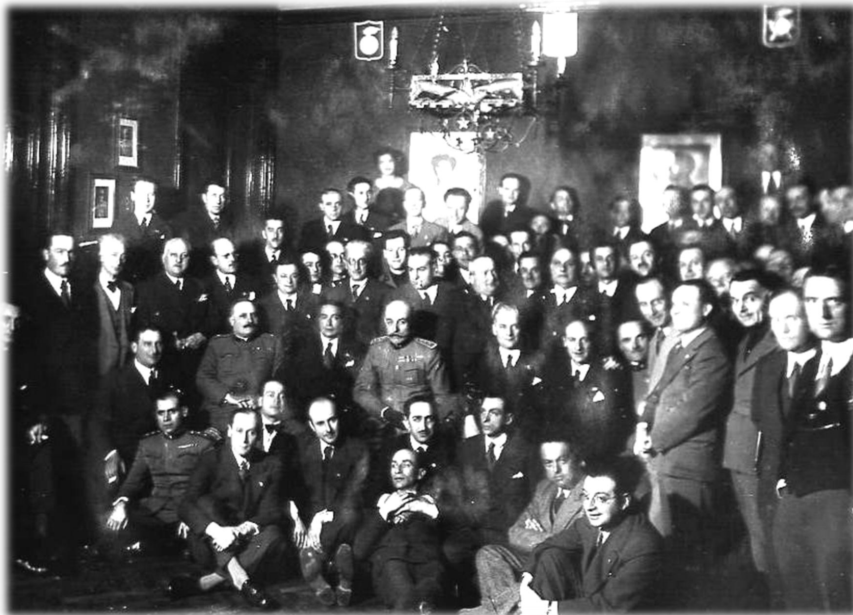
Monza 1929- Inaugurazione Sede UNUCI