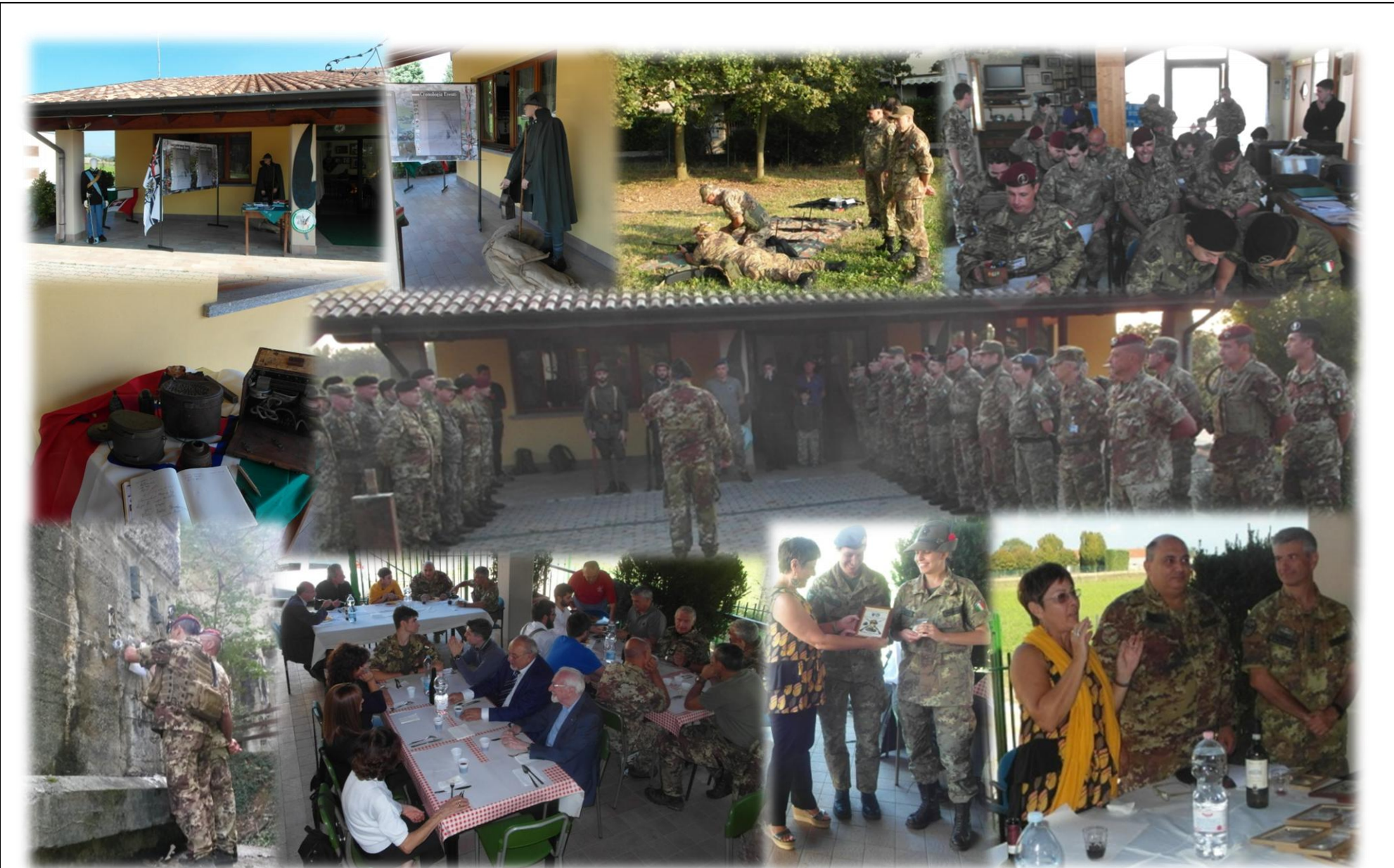
XVII TROFEO TEN. MOVM Raffaele MERELLI – Gara di Marcia e d Orientamento – Tregasio, 25 settembre 2016