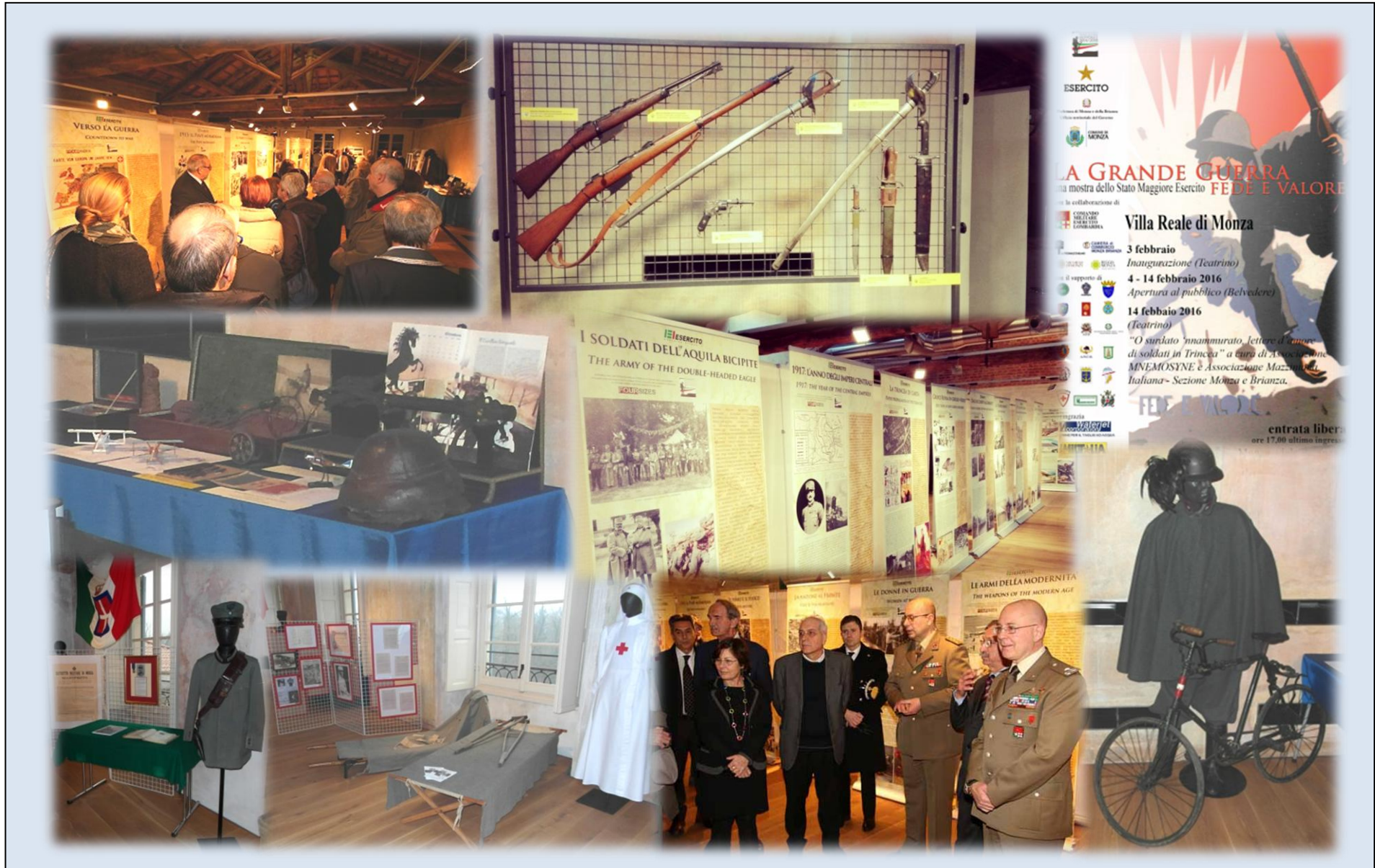
La Grande Guerra. Fede e Valore , mostra dello SME svoltasi alla Villa Reale di Monza nel Gennaio 2016 con la collaborazione della Prefettura, dell'UNUCI, delle Associazioni d'Arma di Monza e Brianza e di alcuni Collezionisti della Grande Guerra.