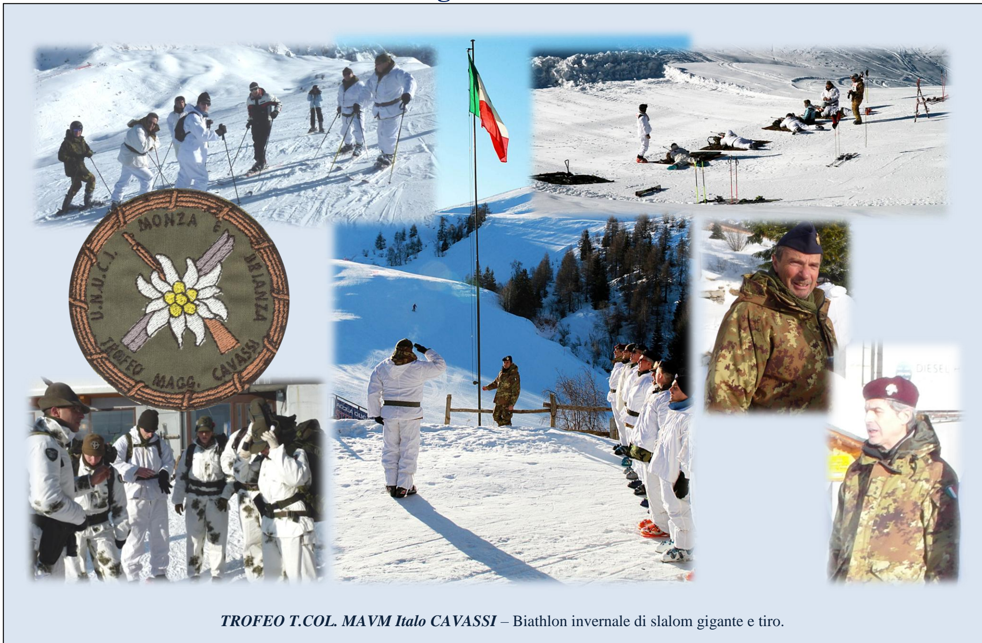
TROFEO T.COL. MAVM Italo CAVASSI – Biathlon invernale di slalom gigante e tiro.