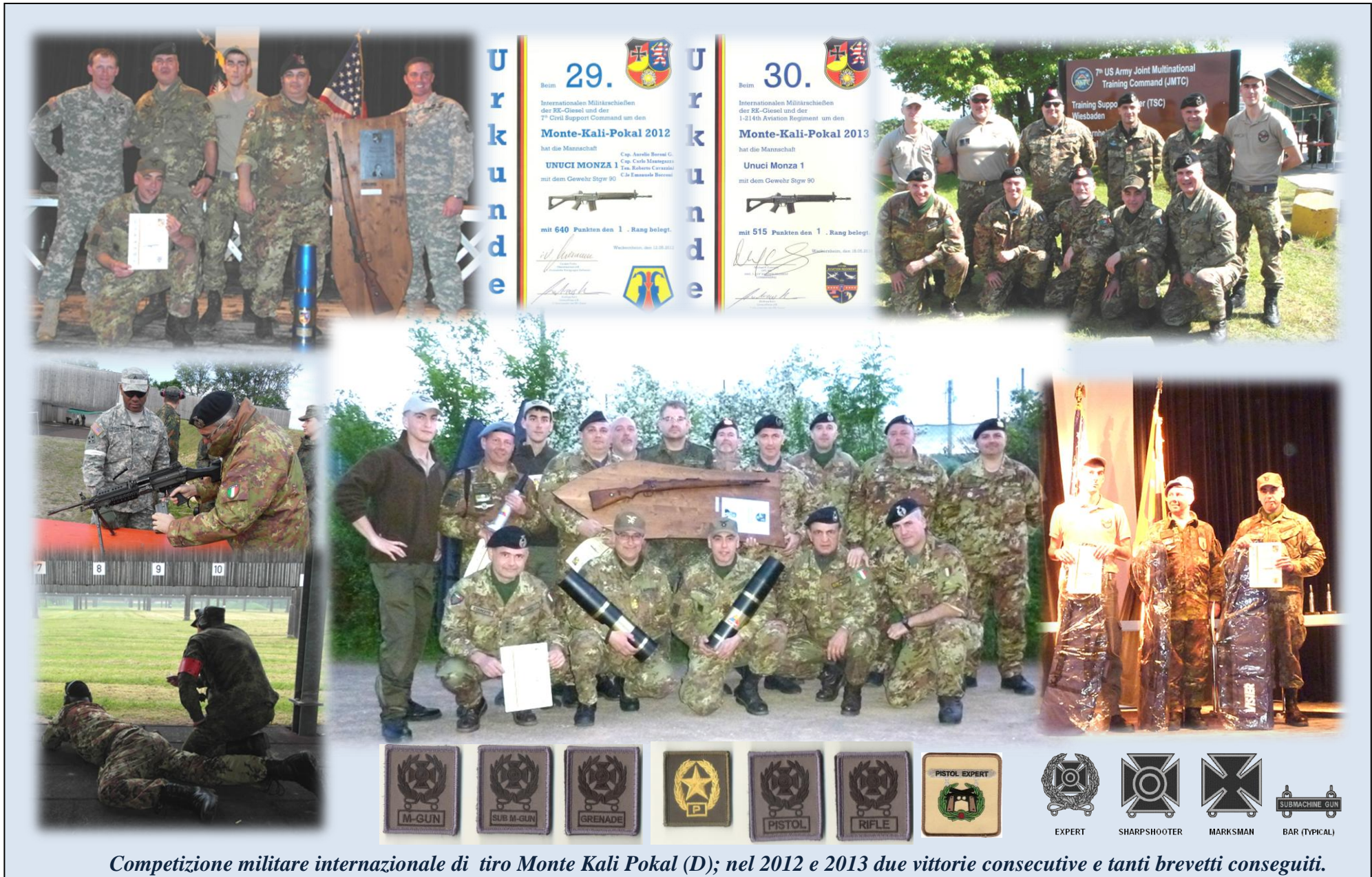
Competizione militare internazionale di tiro Monte Kali Pokal (D); nel 2012 e 2013 due vittorie consecutive e tanti brevetti conseguiti.