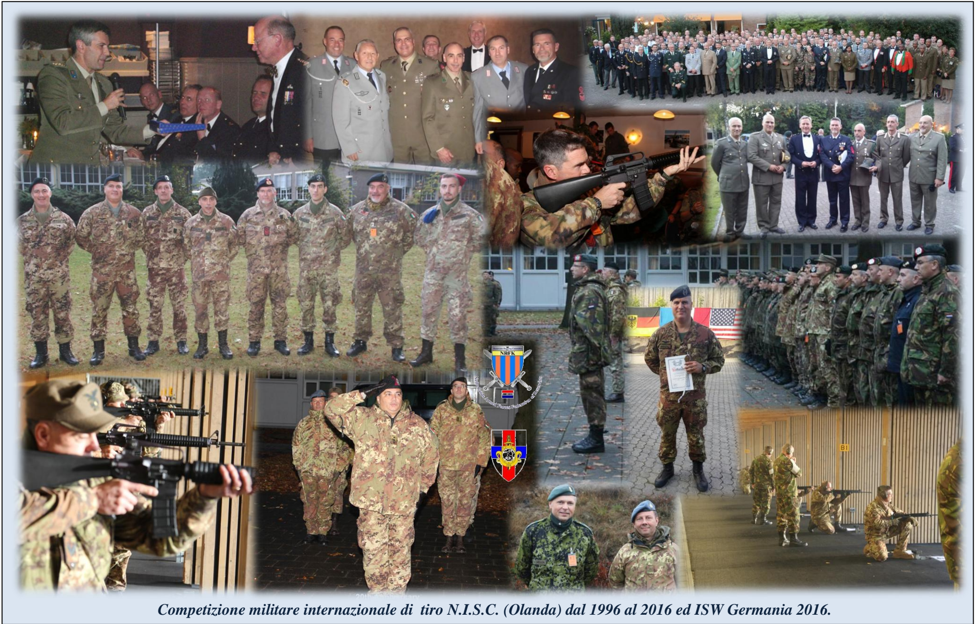
Competizione militare internazionale di tiro N.I.S.C. (Olanda) dal 1996 al 2016 ed ISW Germania 2016.