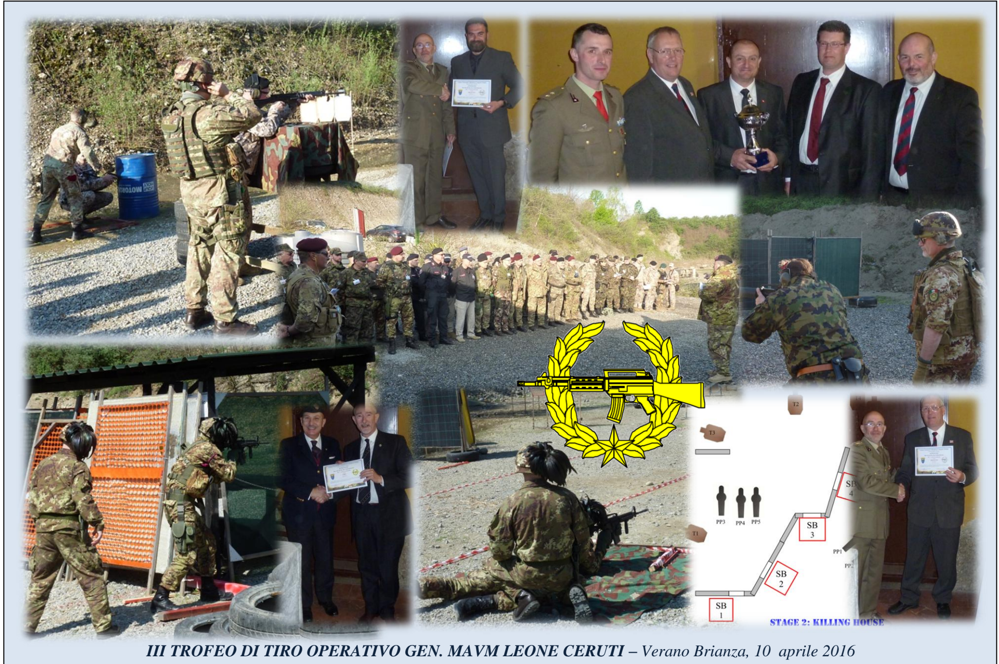
III TROFEO DI TIRO OPERATIVO GEN. MAVM LEONE CERUTI – Verano Brianza, 10 aprile 2016