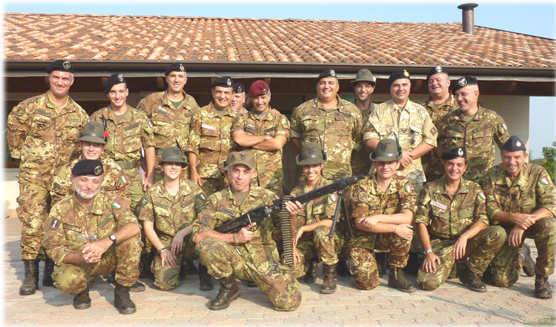
Foto di Gruppo dei collaboratori di molte attività operative della sezione.