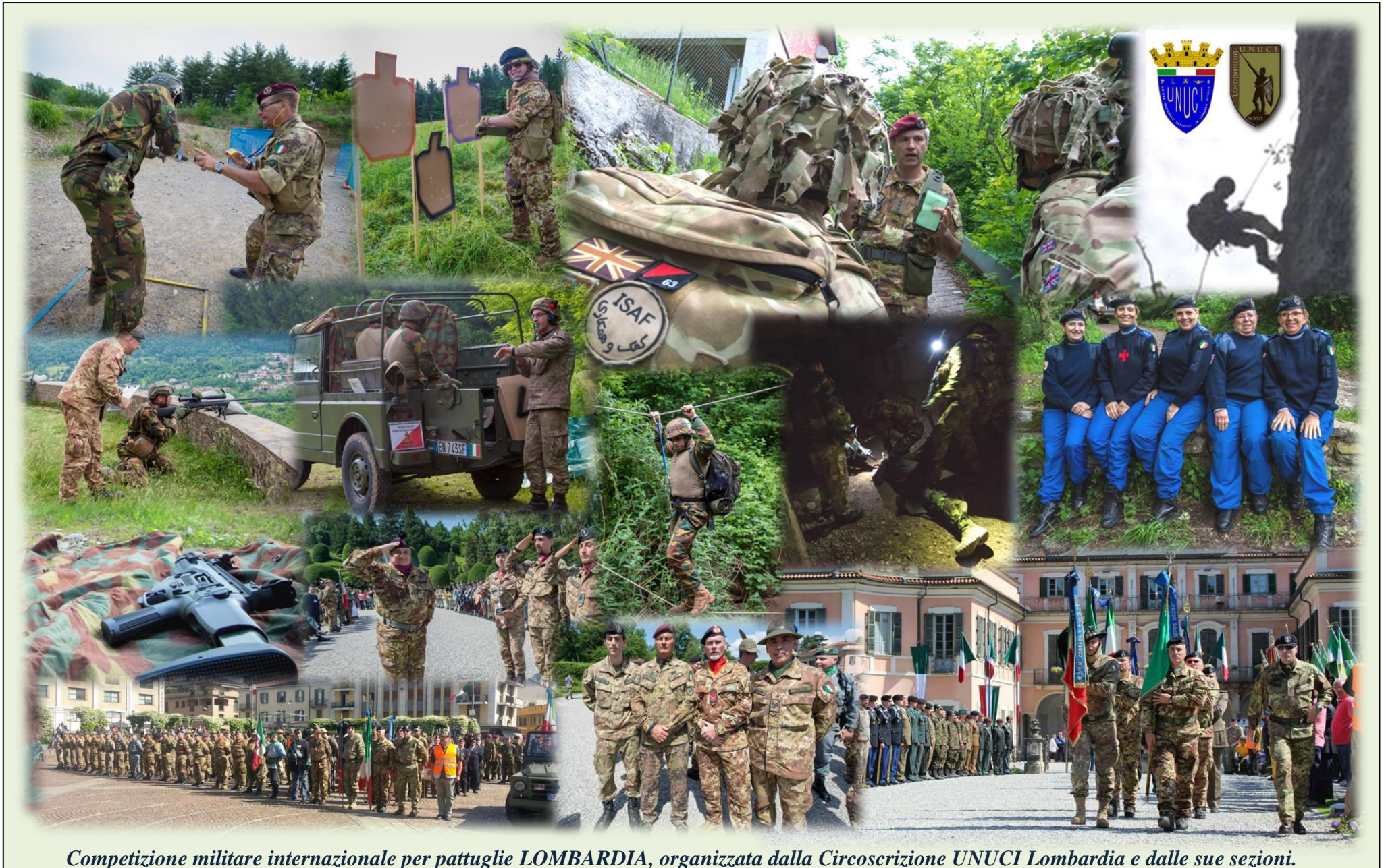
Competizione militare internazionale per pattuglie LOMBARDIA, organizzata dalla Circonscrizione UNUCI Lombardia e dalle sue sezioni.