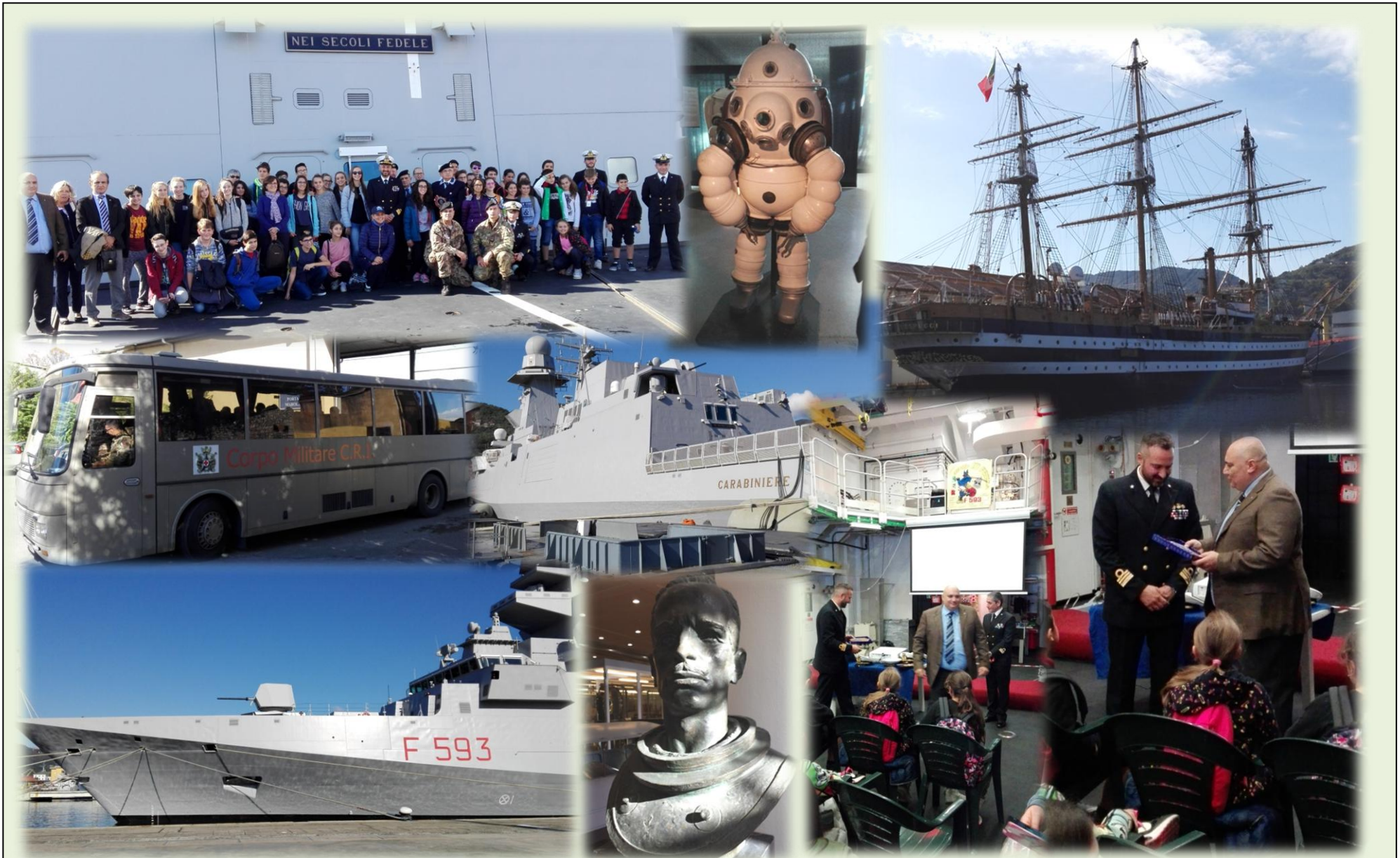
Base Navale de La Spezia: visita alla Fregata Carabiniere, FREMM classe Soldato, e al Museo Tecnico Navale